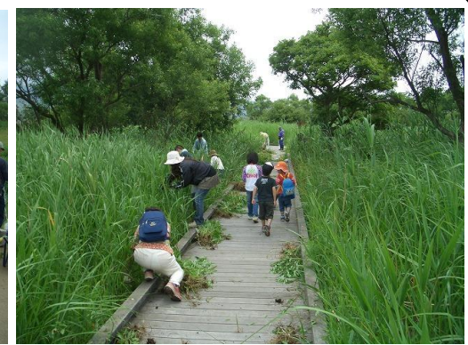
浮島ヶ原自然公園の草刈り (6/13) ・・・4月に正式オープンしたこの公園は毎日多くの方が訪れています。この日は外来種のセイタカアワダチソウの引抜き作業に参加しました。学びながら、より楽しく利用できる公園とするため、関係者による持続的な管理運営体制の確立が急務です！