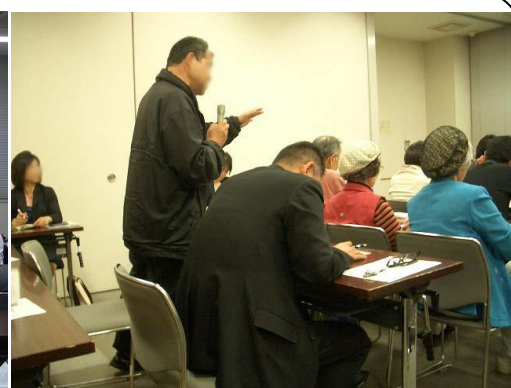
三島市議会の議会報告会視察 (5/27) ・・・「市民に開かれた議会」を目指す取組みの一環として行なわれた三島市の議会報告会を視察しました。市民の方々から厳しい意見も多数ありましたが、富士市議会でも直接市民の皆さんと意見交換する場の必要性を感じます！