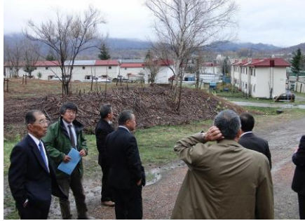
夕張市視察 (5/6～8) ・・・所属する会派・市民クラブで3年前に財政破綻した夕張市(北海道)を視察しました。富士市は現在まだ財政的に余裕がありますが、今後は不透明です。チェック機関としての議会の責任の重さを改めて感じました！