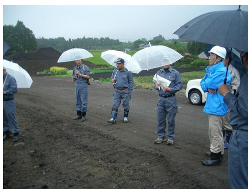
富士山麓の土採取現場視察 (5/19) ・・・市民クラブで土採取現場を視察しました。建設・農業用の土砂を採取し、建設残土を埋め戻すケースが大半ですが、中には廃材の埋立てや届出とは異なる造成が行なわれています。適切な指導・取締りができる条例制定が進んでいます。