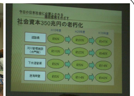
建設産業フォーラム (5/22) ・・・厳しい財政状況と公共投資が減少する中で、建設産業の今後を考えるフォーラムです。高度成長期に建設整備された社会資本が老朽化する中で、「新規の建設」から適切な「維持修繕」にシフトした行政・業界の取組みの必要性を感じます！