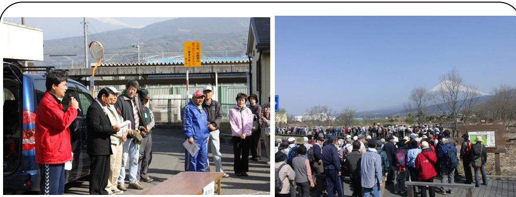
沼川・お花見ウォーク (3/14) ・・・「そうだ！沼川プロジェクト」の取組みで、東田子の浦駅から沼川、滝川、田宿川沿い約 8km のウォーキングです。昨年から有志の皆さんと草刈り(土手普請)を進めコースを整備してきました。550名の参加で大盛況でした！