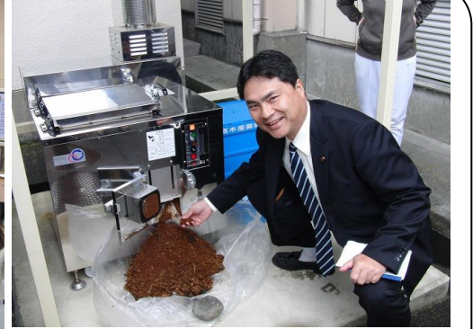
天間小学校視察 (5/11) ・・・7名の同期議員の研修組織「チャレンジ改革セブン」で天間小の英語の授業などを視察しました。「ビビンバ」、「ワカメと野菜のスープ」などの給食も、子ども達と一緒にいただきました。給食の野菜くずや残飯は「生ごみ処理機」で堆肥化されます。