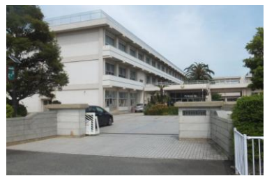
小中学校(写真は今泉小学校)