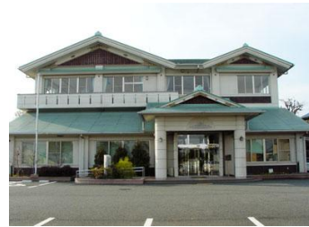
まちづくりセンター(写真は今泉)