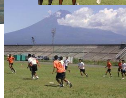
↑アルティメットの全国大会 ←市長答弁で例として出された全日本少年サッカー大会