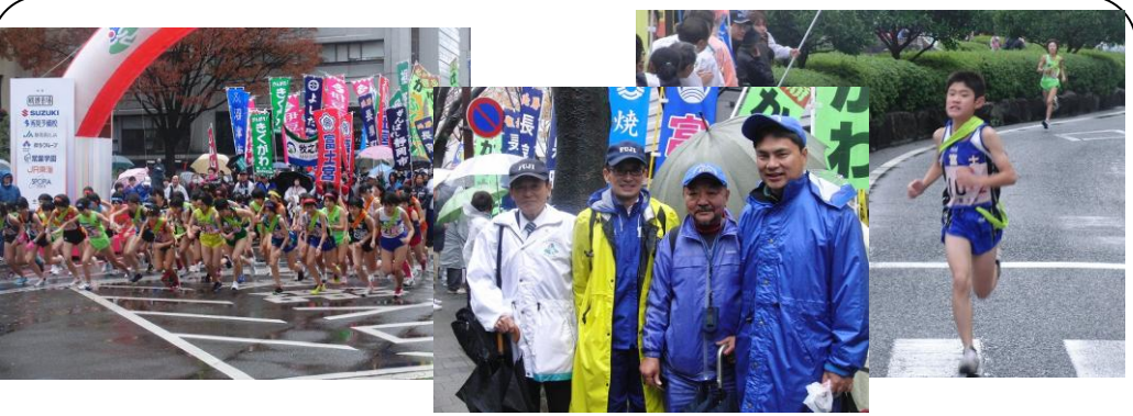
静岡県市町対抗駅伝の応援 (12/3) ..今年で12回目となる市町対抗駅伝を初めて現場で応援しました。雨が降るあいにくの天候でしたが、懸命に走る各市町のランナーから勇気をもらいました。我が富士市は、終盤の追い上げで「市の部」で見事4位に入賞しました！