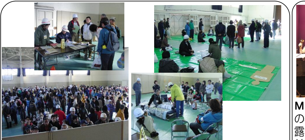
富士高での避難所運営訓練見学 (12/4) ..災害時に富士高を避難所として使うことになっている周辺の4区(本市場新田、中島下、中島新道町、松本)の皆さんが1年かけて策定した「避難所運営マニュアル」に基づき初めての運営訓練を行い、私も見学しました！