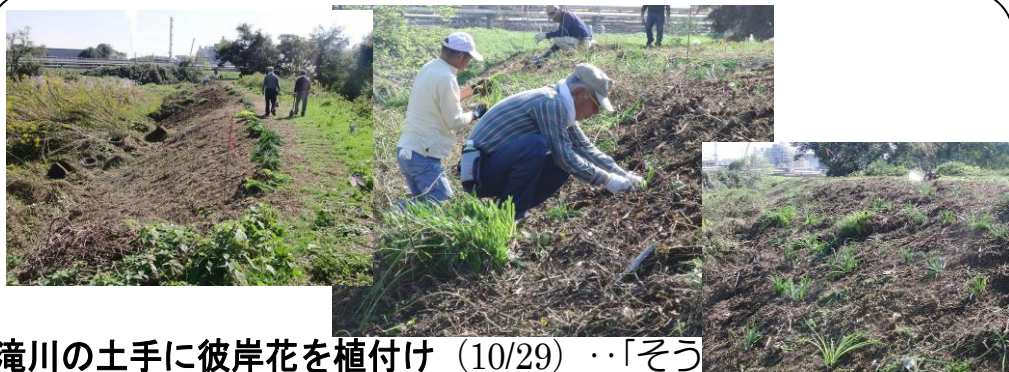
滝川の土手に彼岸花を植付け (10/29) ..「そう だ!沼川プロジェクト」で土手の法面の草を刈り、群生している彼岸花を株分けして植付けました。一人が10mの区間を受持ち今後は草刈り等の管理をしていく予定です。皆さんも是非「10m区間の彼岸花の里親」になってみませんか？10年後には花で埋め尽しましょう！