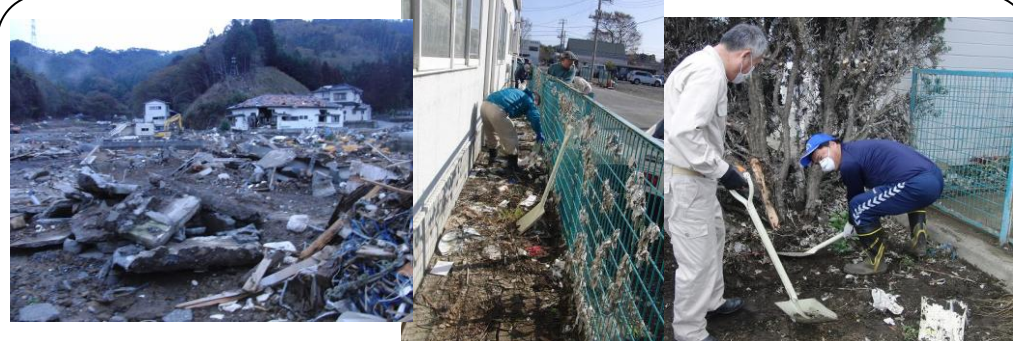
東北の被災地で2回目の泥かきボランティア (11/7～9) ..5月に続き同じ会派の議員有志5名で石巻市でボランティアに参加しました。女川町の小集落は震災時のままでした。また市内各所に高く積み上げられたガレキの山の早急な処理を感ずります。安全が確認できたガレキの処理は、富士市を始め全国の自治体が協力すべきと考えます！