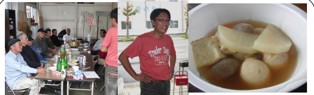
「小潤井川 友の会」が設立 (11/6) ..私が生まれ育った津田・荒田島地区を流れる小潤井川で、地区の有志の皆さんと6月から3回草刈り・清掃を行いました。そんな中から「もっと小潤井川で遊べるよう、きれいにしよう」、「川に降りられるスロープを県に提案しよう」等の意見が出て、この日「小潤井川 友の会」の設立芋煮会が行われました。あいにくの雨でしたが、これから本格的に活動開始です！