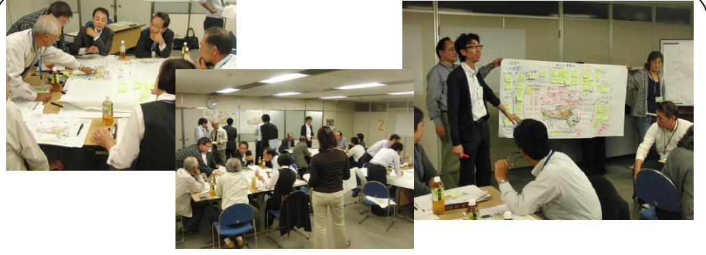
吉原公園再整備検討会 (10/31、12/8) ..吉原、今泉地区計20人の市民の皆さんで9月から始まった検討会の2、3回目が行われました。3つのグループに分かれ、現在の公園部分と新たに加わる東泉院跡(六所家敷地)のあり方について、白熱した検討が続きます。