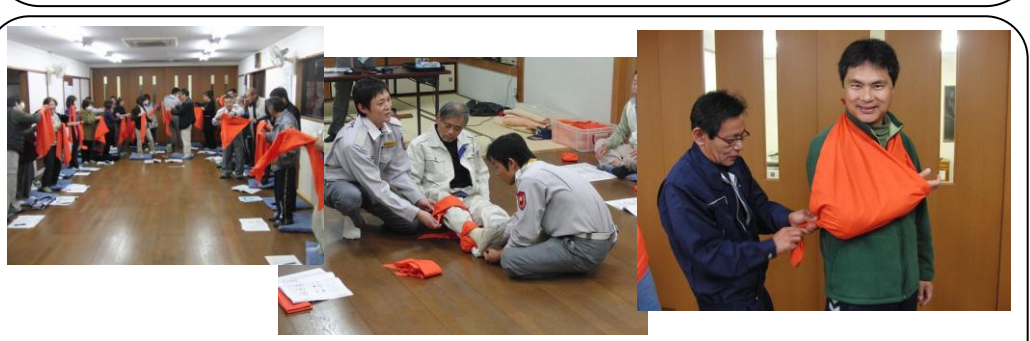
自主防災会で応急救護講習会 (11/16・17) ..私が会長を務める駿河台3丁目自主防災会で、地震などの災害時に怪我をした人を搬送したり、三角巾を使い応急救護を行うための講習会を開催しました。富士市消防本部の救急隊の皆さんに講師を依頼。これから毎年行い、町内のより多くの方が手当をできる側になれるようにしましょう！