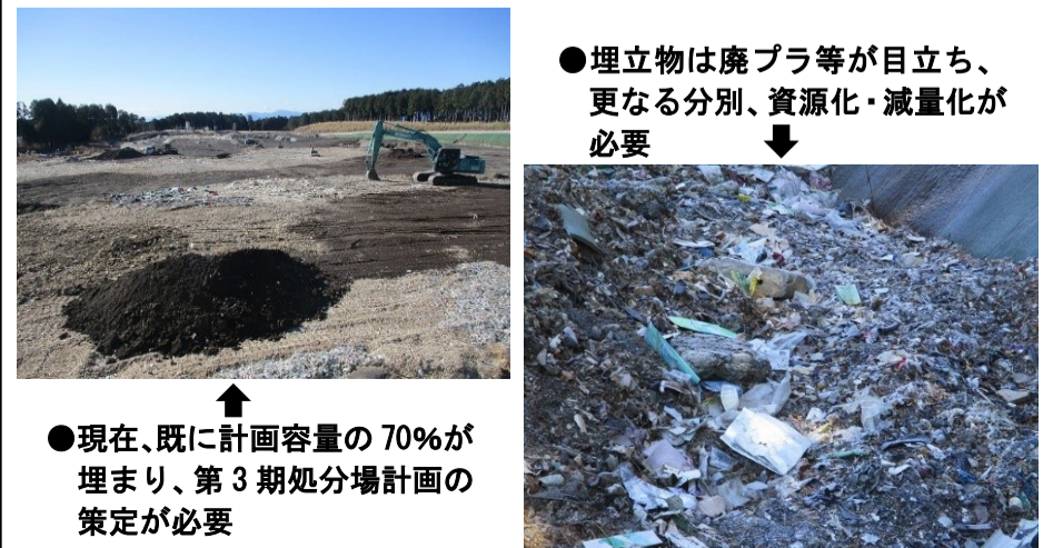
●埋立物は廃プラ等が目立ち、更なる分別、資源化・減量化が必要