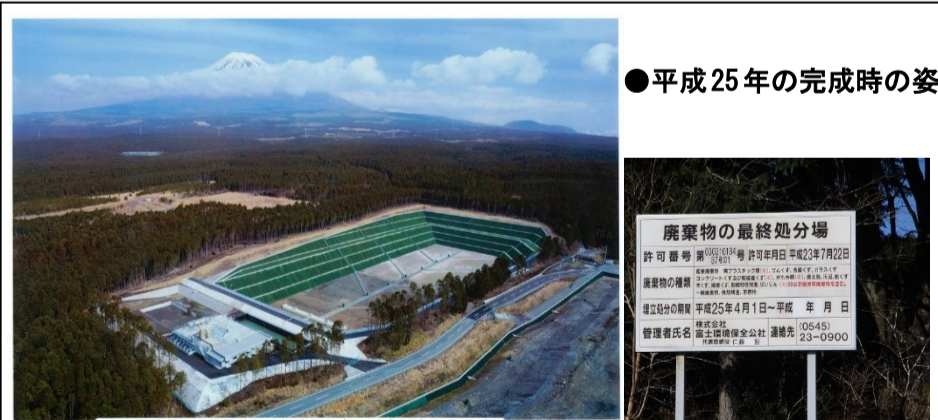
●平成25年の完成時の姿