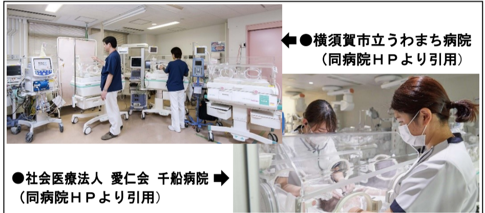
●横須賀市立うわまち病院